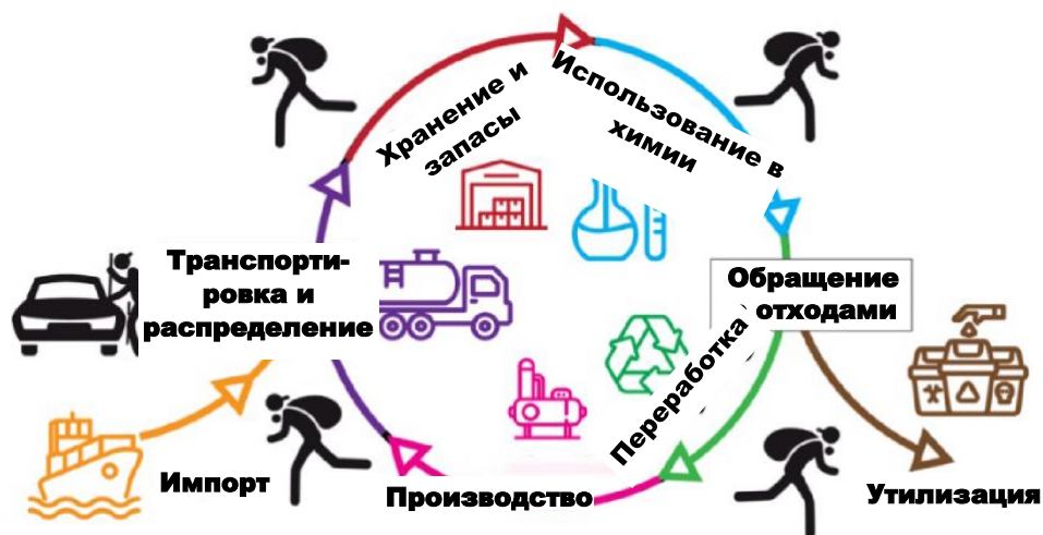
Рис. 4. Химический жизненный цикл уязвимостей в области ХБТБ 31